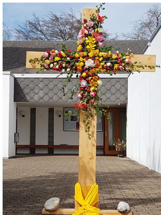
Weg zum Kinde 2011