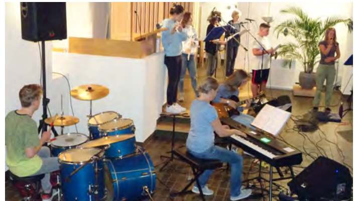
In der Band «One Spirit» spielen Jugendliche und Erwachsene miteinander Pop-Rock-Songs.

V ielfältiger ist sie geworden, die Musik in den Gottesdiensten. Neben der Orgelmusik, die nach wie vor sehr wichtig ist, gibt es Feiern, die von den Jodlern aus Recherswil oder Oekingingen, von den Blasmusikern aus unseren Dörfern oder von Ensembles, die klassische oder jazzige Musik pflegen, mitgestaltet werden. Einmal pro Jahr geniessen wir eine musikalische Meditation mit dem Singkreis Wasseramt. Weitere Besonderheiten sind unser Ad-hoc-Chor und die Instrumentalisten, die an Heiligabend singen und spielen oder die Auftritte der Band «One Spirit». In dieser Gruppe spielen Jugendliche und Erwachsene miteinander Pop-Rock-Songs. Jahrhundertlang war die Kirchenmusik davon geprägt, dass sie explizit als Gotteslob komponiert wurde – und dafür bediente man sich nur der höchsten Kunst. Die Kom-