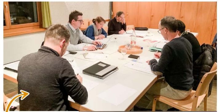
Arbeit im Pfarrkreisrat