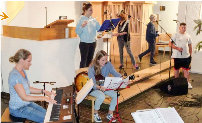
One Spirit – Unser Bandprojekt für Jugendliche und Erwachsene.