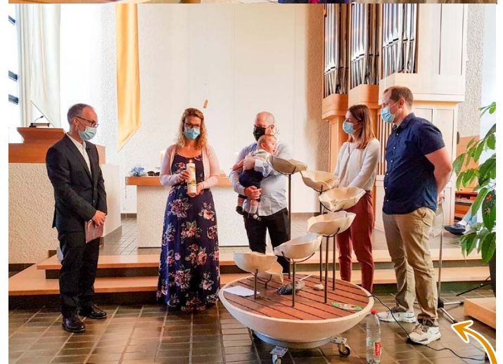
Immer wieder ist es berührend, ein Kind in der Taufe willkommen zu heißen und ein Fest des Lebens und der Dankbarkeit zu feiern.