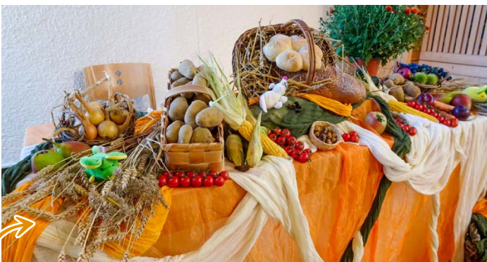
Der wunderschön dekorierte Abendmahlstisch für die Erntedankfeier