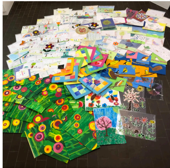
Über 200 Zeichnungen kamen zusammen